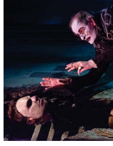
Lysande utsikter Vaudeville Theatre, London